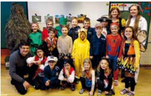
Lei Lustig! - Närrisches Treiben am Faschingsdienstag.