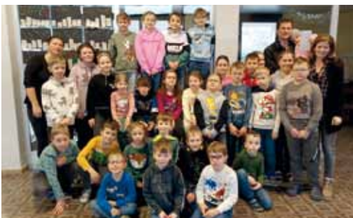
Herzliches Dankeschön an den MGV Granitztal für die finanzielle Unterstützung.