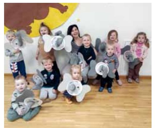
Zu Besuch im Dschungel bei den Elefanten.