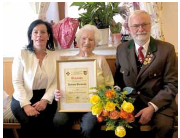
Ehrung durch den ÖKB St. Paul.

sich, um die frische Luft und ein paar Sonnenstrahlen zu genießen – wohl eines der Geheimnisse ihrer unvergleichlichen Gesundheit. Als älteste Wählerin der Marktgemeinde ließ sie sich Anfang März auch den Gang zur Wahlurne nicht nehmen, um aktiv den Landeshauptmann von Kärnten mitzubestimmen. Mit ihrem immer noch sonnigen Gemüt ist sie ein Vorbild, nicht nur für ihre Kinder, sondern auch für die Enkel, Urenkel und Ur-Urenkel.