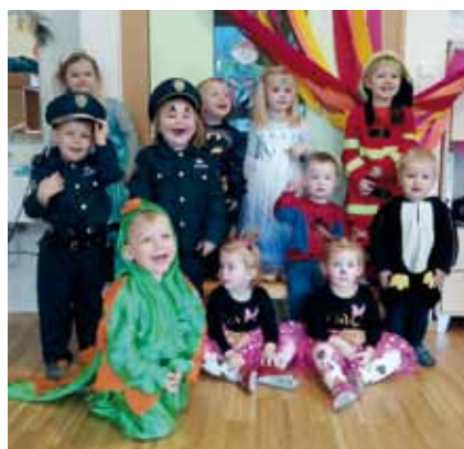
Die Narren sind los.