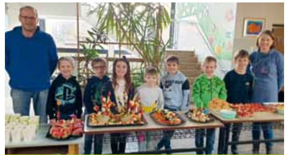
„Gesunde Jause“ im Granitztal.