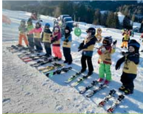
Die kleinen Skistars aus dem Granitztal auf der Petzen.