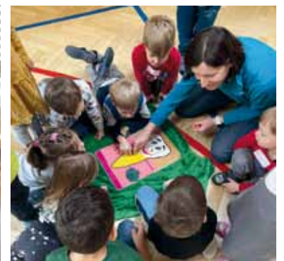
Zahnprophylaxe im Kindergarten St. Paul.