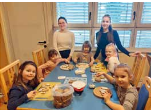
Zum Thema „Bauernhof“ gab es eine Bauernjause von unseren Praktikantinnen.