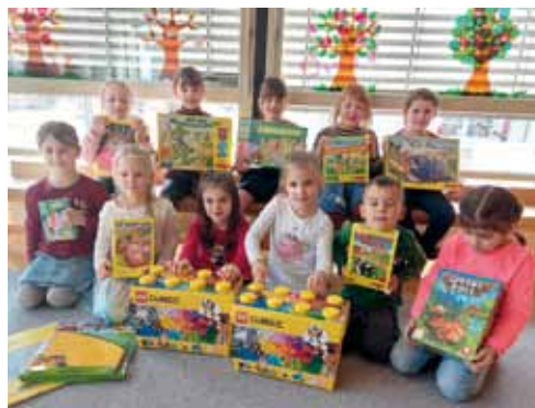
Neue Spiele und Lego für jede Gruppe. Herzlichen Dank an die Eltern.