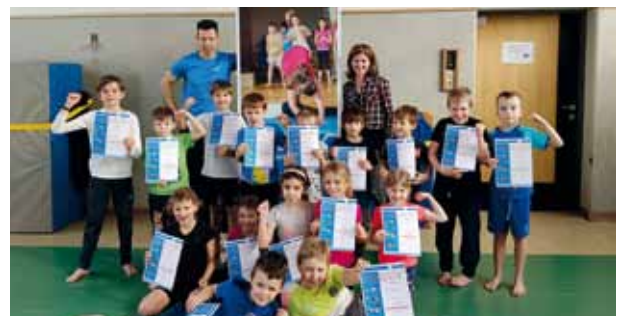
Sturz- und Falltraining der AUVA in der VS Granitztal.