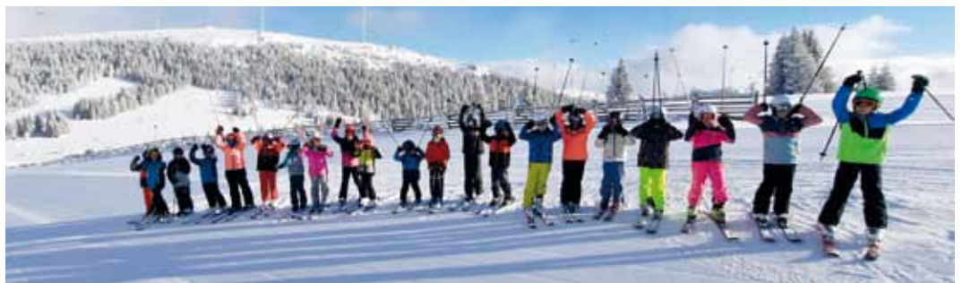
Ski- und Rodeltag auf der Weinebene.