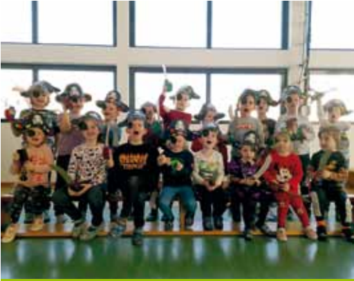
Piratenfest im Granitztal.