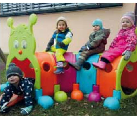
Im Garten ist es lustig.