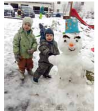
Endlich, wir können einen Schneemann bauen!