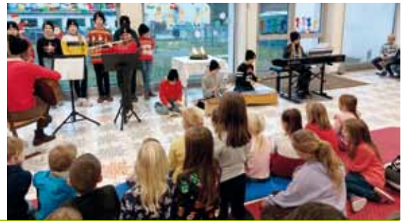
Weihnachtsfeiern in den Volksschulen Granitztal und St. Paul.