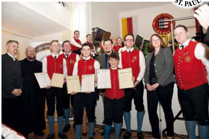
Ehrung der erfolgreichen Jungmusiker im Rahmen des Jahreskonzertes.

Auch Musicalsfans kamen mit einer Zusammenstellung aus dem weltbekannten Musical „Elisabeth“ auf ihre Kosten. Mit dem „80er Kult(tour)“-Medley konnten die Zuhörer in nostalgischen Klängen den 1980ern gedenken. Den Abschluss fand das Konzert in einer besonderen Zugabe: Mit der Blasmusikversion von „Music“ von John Miles brachte der Klangkörper seine Liebe zur Musik zum Ausdruck – frei nach der Textzeile „Music was my first love, and it will be my last“.