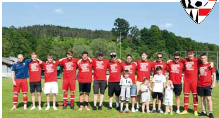
Meistertitel für die Challenge-Mannschaft in der 2. Klasse C.