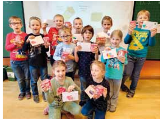
Gemeinsames Basteln für den Muttertag.