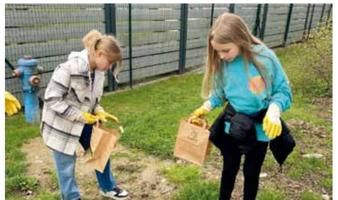
Beide Volksschulen beteiligten sich bei der Flurreinigungsaktion der Gemeinde.