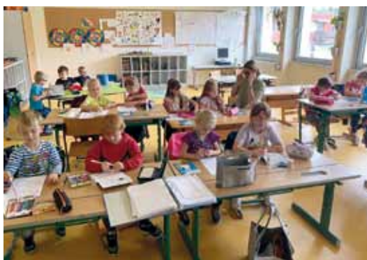
Vorbereitung auf die Schulzeit in der Volksschule St. Paul.