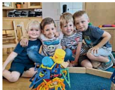
In der Bauecke werden wir kreativ.