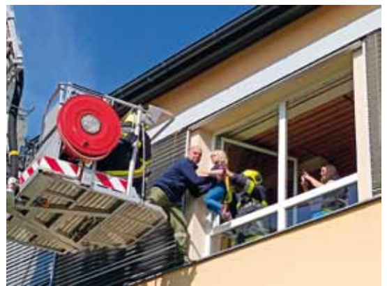
Große Feuerwehrrübung der FF Granitztal mit Einsatz der Hebebühne als besonderes Highlight. Herzlichen Dank an die Kameraden.