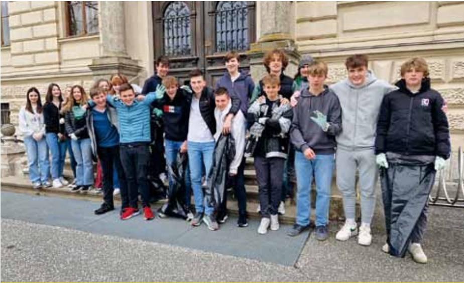
An der Flurreinigungsaktion teilnehmende Schüler des Stiftsgymnasiums St. Paul.