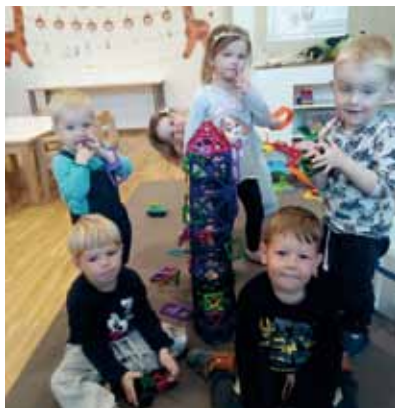
Wir bauen einen riesigen Turm.