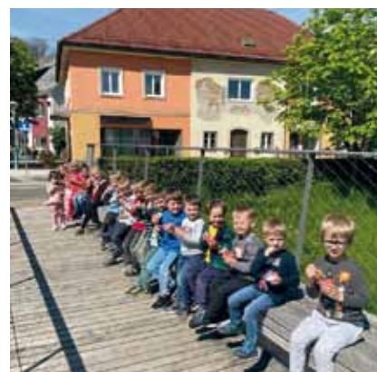
Eis essen vor dem Rathaus.