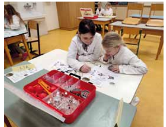
NAWI-Unterricht in der 4. Klasse.