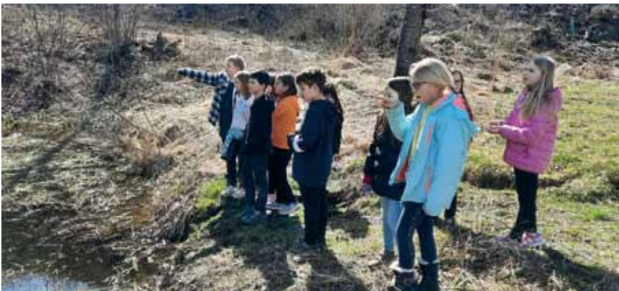
Frühlingsblumensuche am Krapfelhofteich.