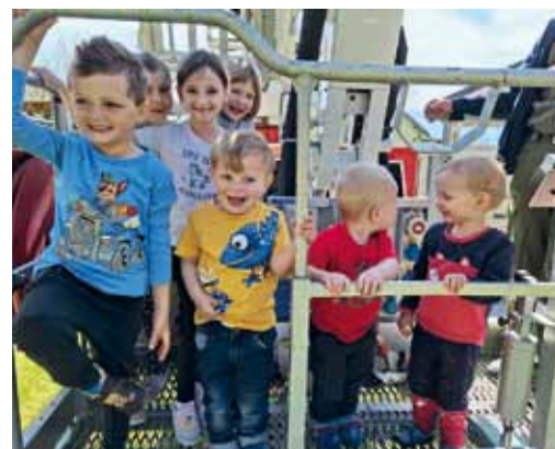
Florianiübung im Granitztal.