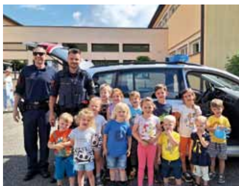
Die Polizei zu Besuch im Kindergarten.