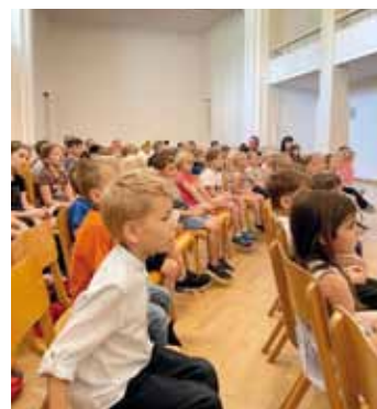
KUSO Kids – Hänsel und Gretel.