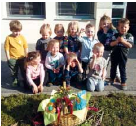
Der Osterhase war da!