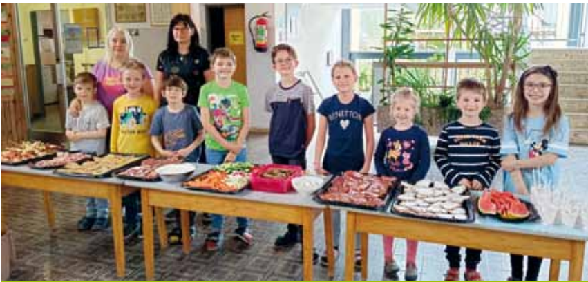
„Gesunde Jause“ im Granitztal.