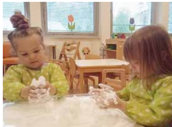
Der Spieleschaum fühlt sich gut an.