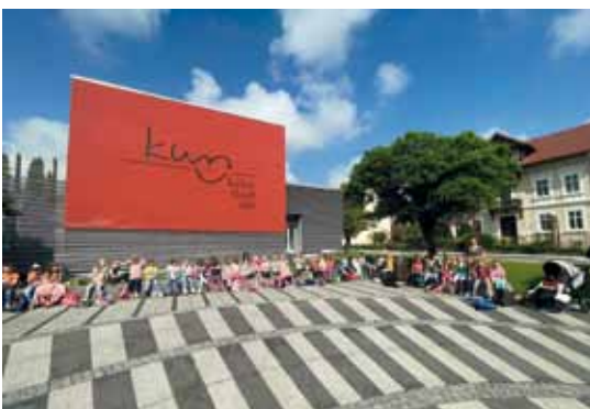
Ausflug zum Kindermusical im KUSS Wolfsberg.