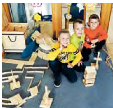
Aus der Bauecke.