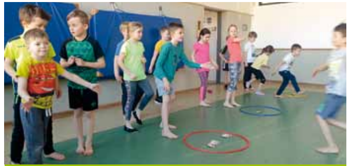
„Hopsi Hopper“-Bewegungseinheit im Turnsaal.