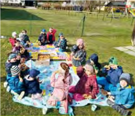
Picknick im Granitztal.