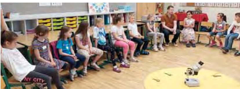
Die 2. Klasse lernte mit dem Kidsmobil viel über Technik.