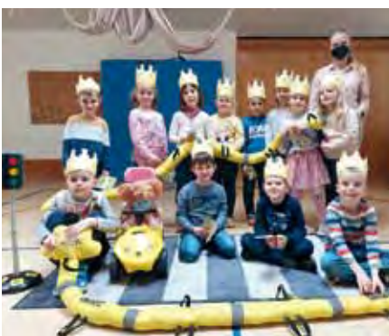
Das kleine „Straßen 1x1“ für unsere Schulanfänger.