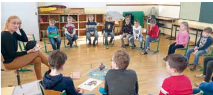
Zahnprophylaxe in der Volksschule Granitztal.