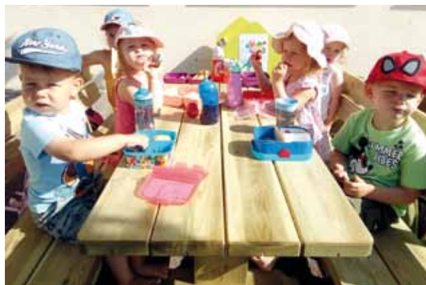
Die Gartensaison ist eröffnet.