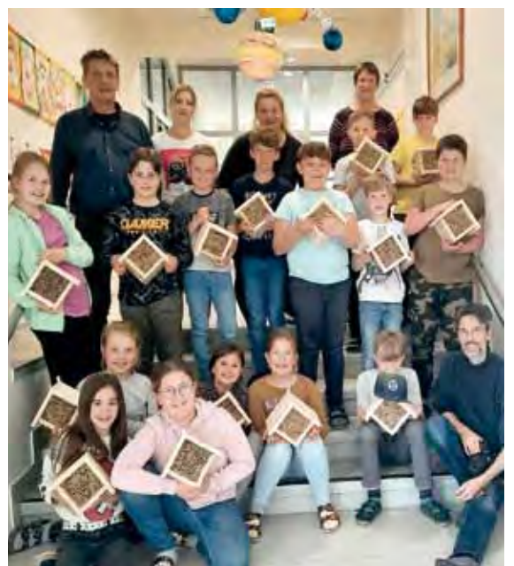
Gemeinsam mit ARGE Naturschutz bastelten die 4. Klassen ein Insektenhotel.