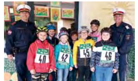
Herzlichen Glückwunsch zur bestandenen Radfahrprüfung.