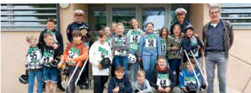
Erfolgreiche Radfahrprüfung auch in St. Paul – Herzlichen Glückwunsch.