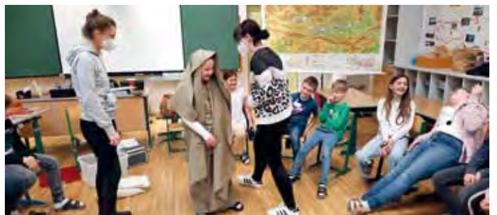
Die 4. Klasse reiste mit dem Kidsmobil in das alte Rom.