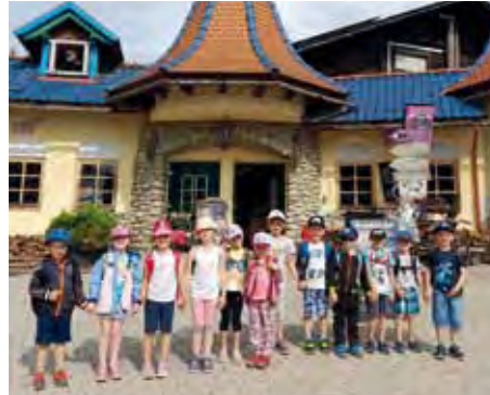
Ausflug in den Märchenwald Steiermark – Herzlichen Dank an unseren Bürgermeister für die Unterstützung.