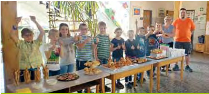
„Gesunde Jause“ der 1. und 2. Schulstufe im Granitztal.