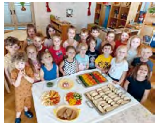
Gesunde Jause im Kindergarten St. Paul.